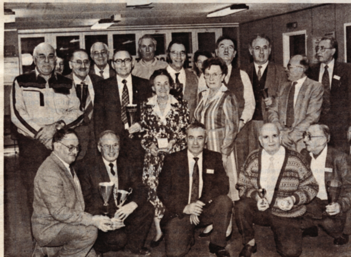
Remise de prix pour animer la flamme des collectionneurs.