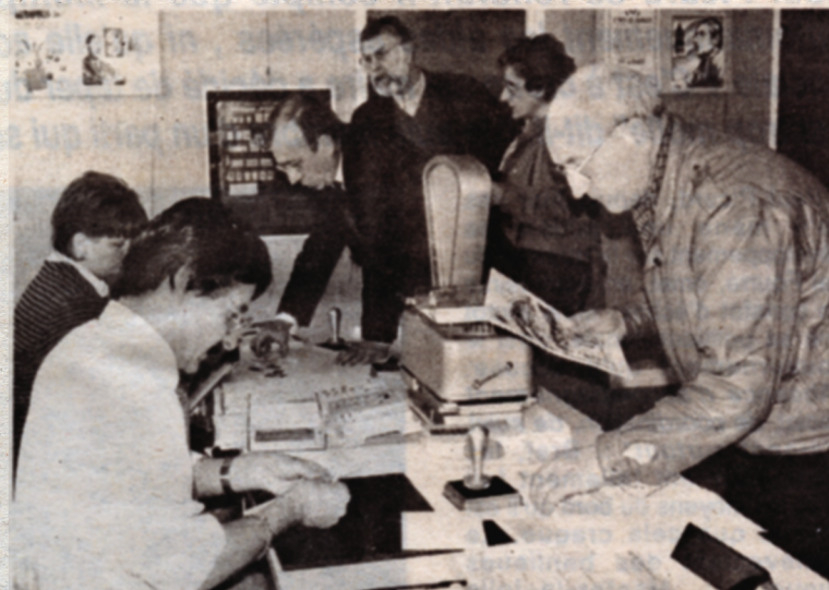
Un bureau de poste temporaire ouvert pour le week-end.